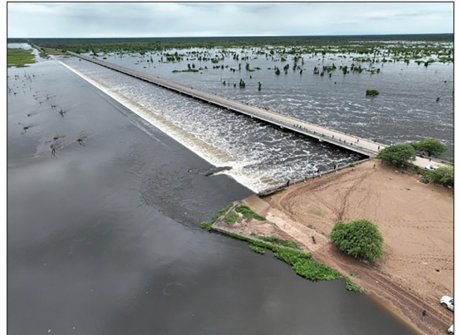
Figura N° 2: Zona de implantación del proyecto

debe construirse desde el diálogo profundo con su entorno. Lejos de entenderse como un objeto aislado, la obra se concibe como parte de un ecosistema ambiental y social, y por ello se estructura sobre principios rectores que guiarán todo el proceso proyectual.